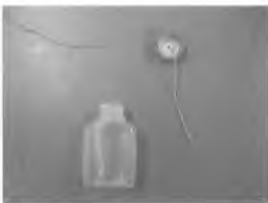
① たれびんのふたに穴を開けて糸を通す。