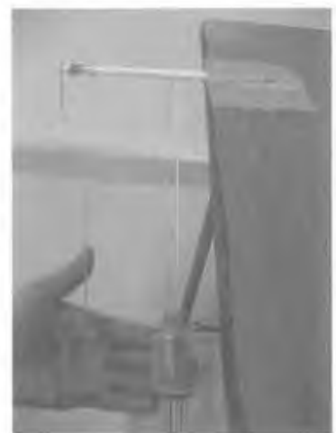
③ できた振り子を机などにテープでとめ、たれびんの重りを同時にはなし、もどってくる時間を調べる。