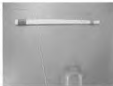
② 2つのたれびんの糸を割りばしにはさむ。